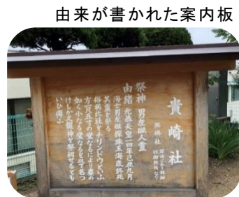
由来が書かれた案内板