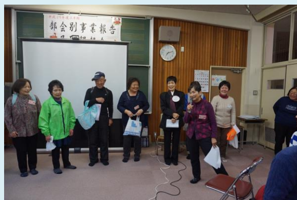
劇団員集合・・・ご苦労様でした。