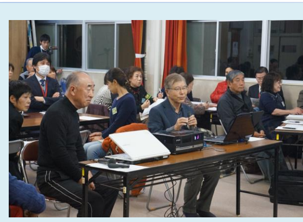
広報部 ホームページを紹介しました。