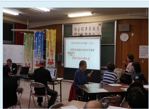
上住さんアイスブレイクはたのしかったです。