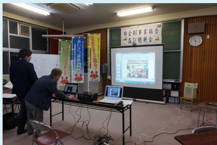
会場の準備も事務局にお世話になりました。