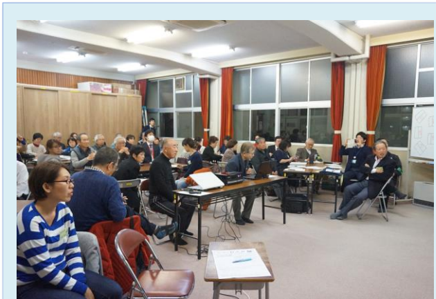
会場いっぱい 1~8 までのグループに分かれた